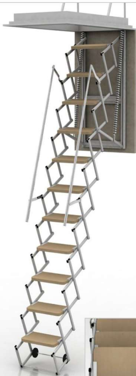
RETTANGOLARI LEGNO NATURALE