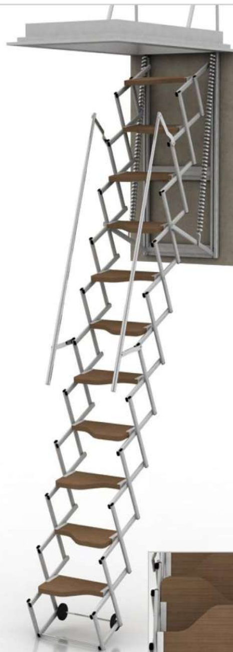
SAGOMATI LEGNO NOCE